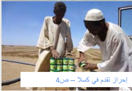
إحراز تقدم فى كسلا - ص4